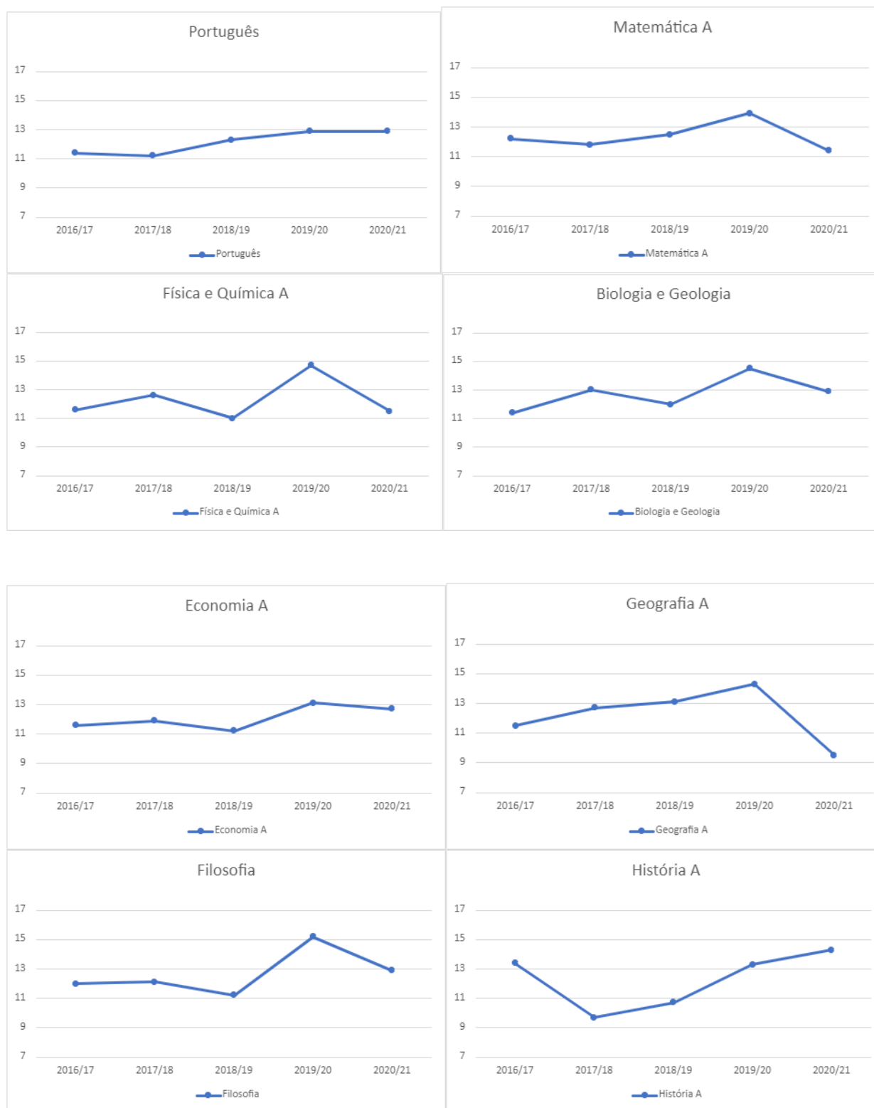
Gráfico 2 – Evolução das Médias de Exame no Agrupamento 2016/17 – 2020/21